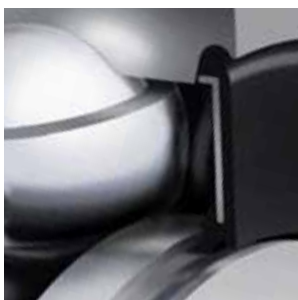
Die neu entwickelte NKE Doppellippen-Labyrinthdichtung