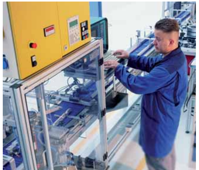
Die 100% Geräuschprüfung garantiert höchste Präzision